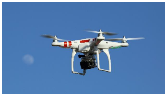
Abb. A-4-6: Mikrodrohne mit montierter HD-Kamera; Quelle: CC BY 2.0 Don McCullough from Santa Rosa, CA, USA