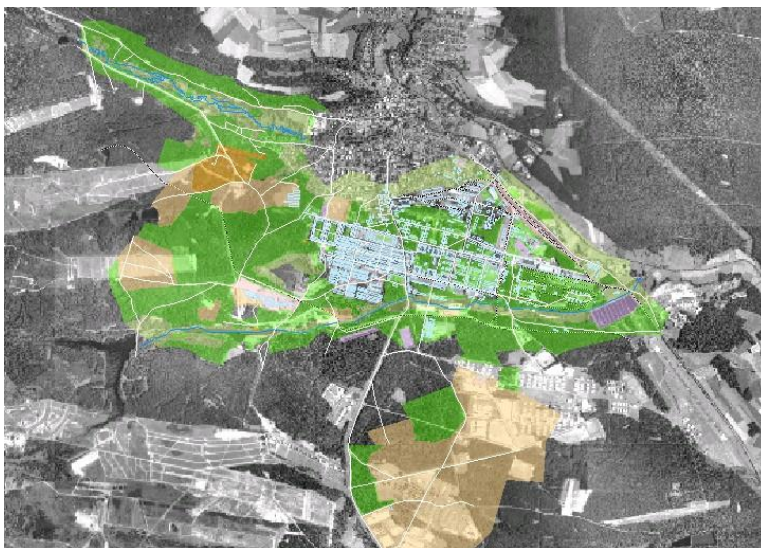
Abb. A-4-5: Thematische Luftbildauswertung