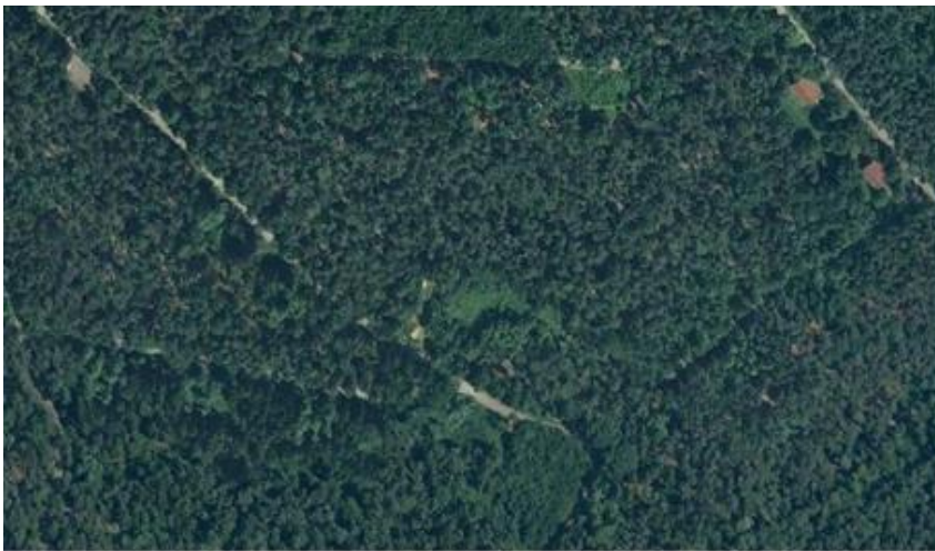
Abb. A-4-1: Beispiel Luftbildausschnitt (ohne Maßstab)

Aktueller Luftbildausschnitt einer Liegenschaft mit ca. 80 Jahren militärischer Nutzung. Im Grundwasserabstrom sind Schadstoffe nachzuweisen, deren Quelle bisher nicht eingegrenzen war. Aufgrund der in den vergangenen Jahrzehnten überwiegend blickdichten Vegetation sind luftbildsichtig keine konkreten Merkmale von Bodeneingriffen oder Vergrabungen zu erkennen.