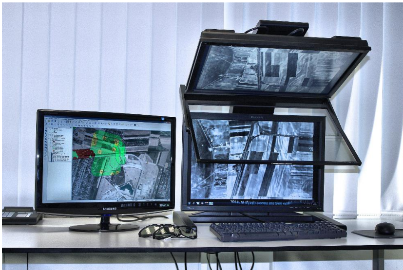
Abb. A-4-3: Arbeitsplatz zur digitalen stereoskopischen Luftbildinterpretation

Ein typischer Arbeitsplatz zur digitalen stereoskopischen Luftbildinterpretation und Datenerfassung. Auf der rechten Seite befindet sich das stereoskopische Display mit zwei Monitoren und Strahlteilerplatte (halbdurchlässiges Spiegelglas). Auf der linken Seite ist das Display für ein Geographisches Informationssystem (GIS), in dem Bildinformationen kartiert und Sachdaten erfasst werden. Für eine stereoskopische Betrachtung der Luftbilder sind bei diesem System Polfilterbrillen erforderlich.